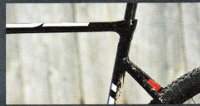
Im Zickzack geht das Oberrohr in den Hinterbau über.