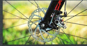
Die TRP-Scheibenbremse am Giant brems zuverlässig.