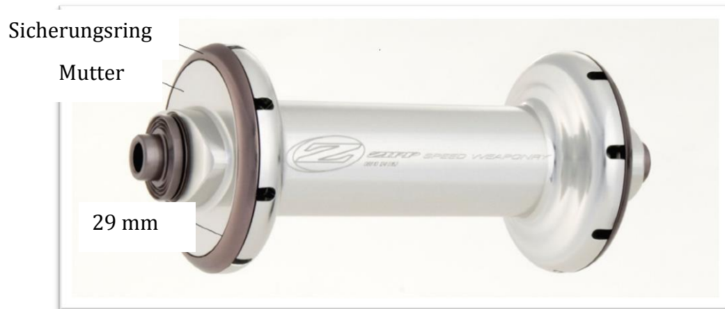
Abbildung 3 - nicht betroffene Nabe

Die Abbildungen UNTEN zeigen eine Zipp-Vorderradnabe, die von dem Rückruf nicht betroffen ist. Beachten Sie die größere, silberfarbene Mutter und den kleineren Sicherungsring.