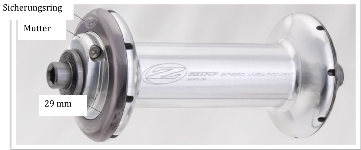
Abbildung 1 – Zipp-Nabe 88 der ersten Generation