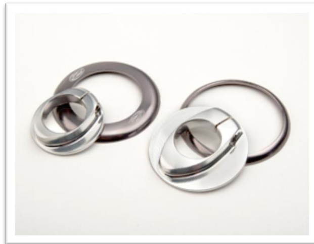
Abbildung 4 - links betroffen, rechts nicht betroffen

5. Die betroffene Nabe besitzt einen Ring und eine Mutter wie die linken Teile in der Abbildung (farbiger Ring mit „Z“-Logo und kleinerer Mutter). Die rechten Teile zeigen einen Ring und eine Mutter, die nicht vom Rückruf betroffen sind . Beachten Sie die größere Mutter (Durchmesser 37 mm) und den dünneren Ring ohne „Z“-Logo (ABBILDUNG 4).